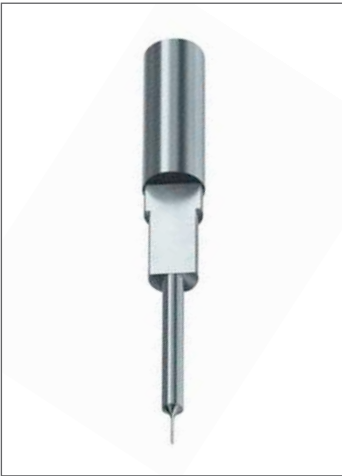
成形件的校准表面