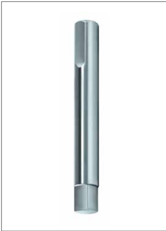
极高的形状和位置精度