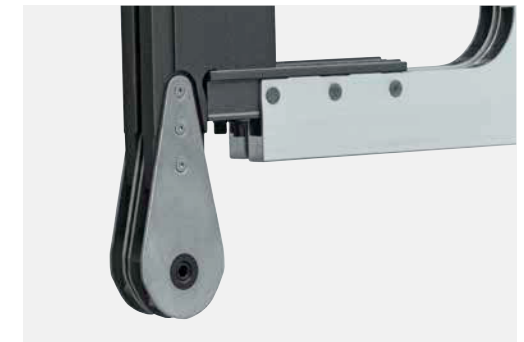
DRC 1E Lasche