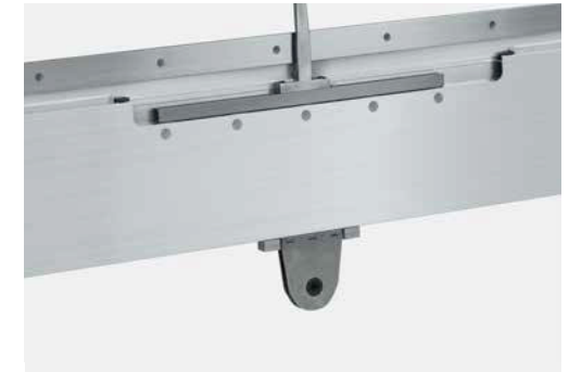
DRC 1E Stollen