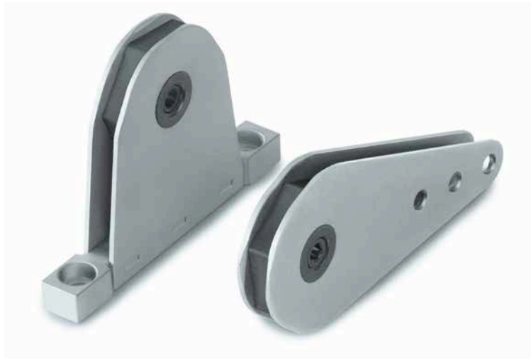
DRC 1E Ausführung Composite

Hochwertige und verschleißarme Materialien gewährleisten eine zuverlässige und lange Funktionsdauer bei geringem Wartungsaufwand.