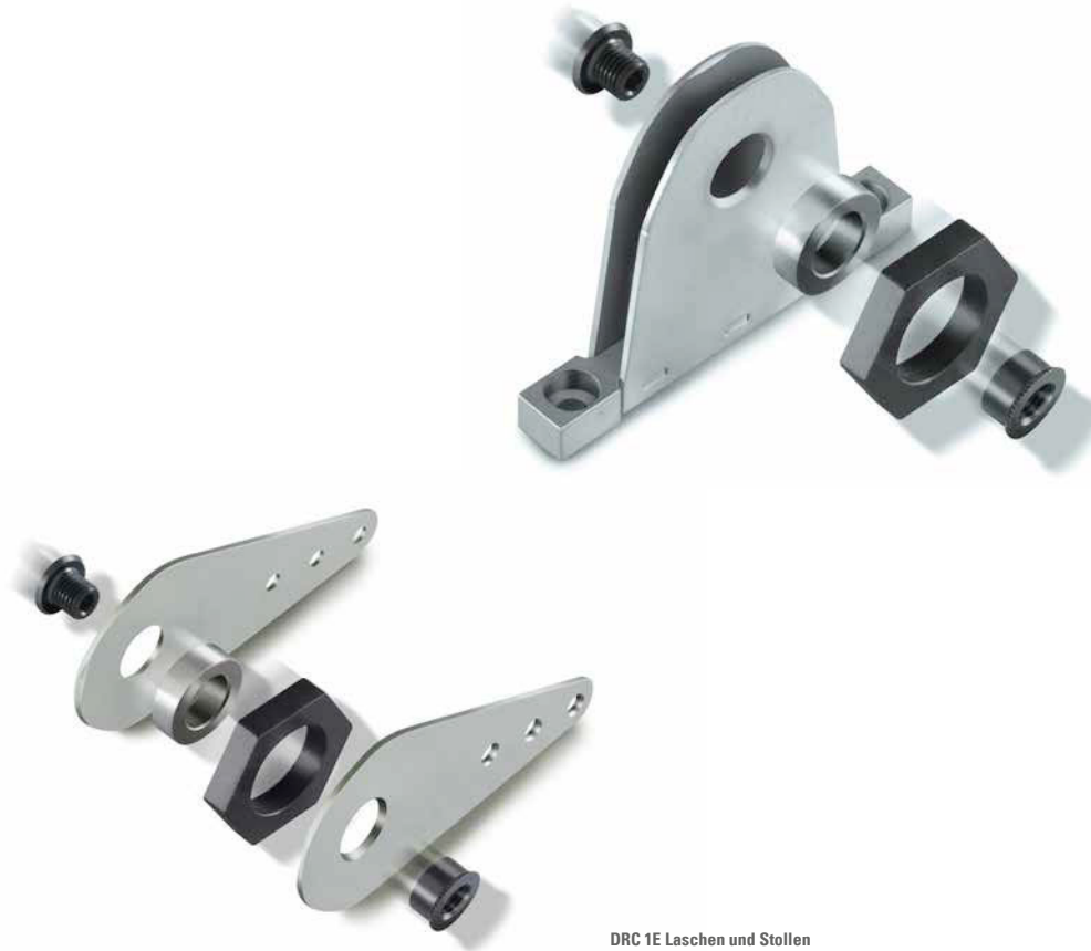
DRC 1E Laschen und Stollen